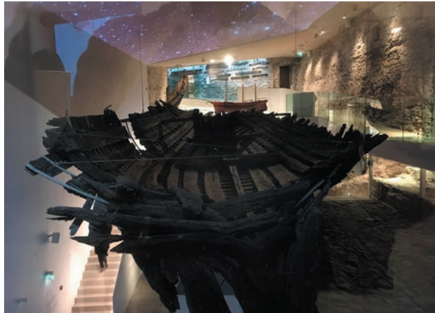
Estonian Maritime Museum, Wrak van een Middeleeuws vrachtschip

In de context van de deelname aan de SMF heeft de OHR ook kunnen bijdragen aan diverse langjarige en grootschalige initiatieven. Enkele kenmerkende projecten zijn de jarenlange steun aan diverse promotietrajecten bij de Vakgroep Maritieme Techniek van de TU Delft (2005-2020), het in stand houden van de leerstoel